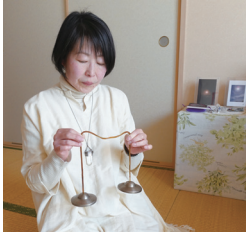
波動測定の前には、ティンシャを鳴らす。チベタンベル、ヒーリングベルとも呼ばれ、チベット仏教の高僧・尼僧が儀式や浄化、魔よけで使う密教法具のひとつ。ここに沁みる美しい音が部屋中に響き渡り、場を浄化すると共に私を波動測定モードに導いてくれます。

そうやって努力しつつも、息子の状態は成長と共に学校はじめ様々な場でトラブルが多く起こってきました。何とかしたい、でも薬は使いたくない。その葛藤の中、ある先生との出会いから漢方薬と治療茶を始めてみました。ですが徐々に漢方では治まらず向精神薬を使用しなければならぬ状態までになってきたのですが、それは絶対避けなかった。やむなく服用すると、目の前の子が恐ろしいことになる姿も見ていたので、これは続けられない、これ以上は与えられないと感じ絶対に薬だけは…と思っていました。思春期に入りいろいろな精神的なトラブルや二次的障害が発症し、入院したりと、私の想いとは裏腹に薬が増える一方になってしまいました。